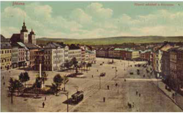
Iglau, alte Ansicht des (unteren) Hauptplatzes, noch mit dem Gebäudekomplex des „Kretzl“.

Es wird Ihnen, liebe Leser so vorkommen, als wäre der folgende Artikel für die Jetztzeit verfasst, tatsächlich aber stammt er aus dem Jahr 1848, dem Revolutionsjahr, in dem nicht nur die Bauern befreit wurden, sondern durch Bauernführer Kudlich und andere auch Freiheit im Sagen und Denken, für die Dinge des Lebens und der Zusammenarbeit untereinander, mit den Arbeitgebern und mit den Behörden erkämpft worden sind. Der von Dr. Merten verfasste Artikel für die Titelseite der ersten Ausgabe des Sonntags-Blattes im Jahr 1848, er könnte tatsächlich heute geschrieben sein: