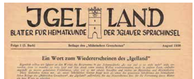
Iggelland-Ausgabe Nr. 1, August 1956

In der nationalsozialistischen Zeit wurde das „Iggelland“ eingestellt. In der letzten Folge vom 24.12.1942 nahm Ignatz Göth von dieser periodischen Veröffentlichung mit folgenden Worten Abschied: „Nun erscheint das „Iggelland“ mit dieser Folge zum letzten Mal in dieser Form. Wann und wie es wieder erscheint, das wissen die Götter. Eines kann ich aber abschließend feststellen: In diesen hundert Folgen steckt eine Summe heimatkundlicher Kleinarbeit, wurden Beiträge veröffentlicht, die für die Forschung wertvoll und einzigartig sind. Die ganze Volksinsel nahm an diesen Veröffentlichungen Anteil, ja wurde von ihr geformt.“ Göth selbst wurden sein glühendes Heimatbewusstsein und leider auch seine Nähe zum Nationalsozialismus – er war ab 1943 Leiter der Presseabteilung in der Iglauer Bezirksleitung der NSDAP – und auch seine Kontakte zum (Reichs-) Deutschen Auslandsinstitut in Stuttgart zum Verhängnis. Sein Leben endete tragisch: Am 10. Mai 1945 tötete erst seine Frau und seine Kinder und dann sich selbst.