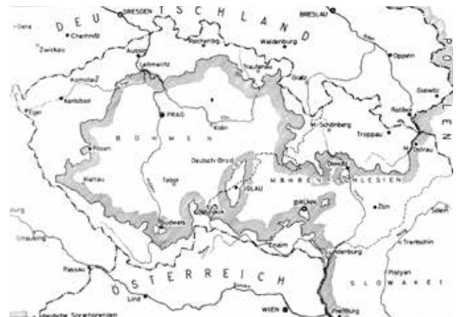
Alte Landkarte, noch mit Böhmischem-Mährischem Gebiet

Als am 28. Oktober 1918 die neue Tschechoslowakische Republik gegründet wurde, haben sich viele Deutsche plötzlich in einem neuen Staat befunden. Die Donaumonarchie war zusammengebrochen. Vergebens hatte die deutsche Bevölkerung (Minderheit) sich um einen Anschluss an Österreich bemüht. Zwar hatte sich die Tschechoslowakei mit der Unterzeichnung des Vertrages zum Schutz der Minderheiten (Pariser Friedenskonferenz September 1919) verpflichtet, trotzdem wurde Tschechisch bzw. Slowakisch zur Hauptspra-