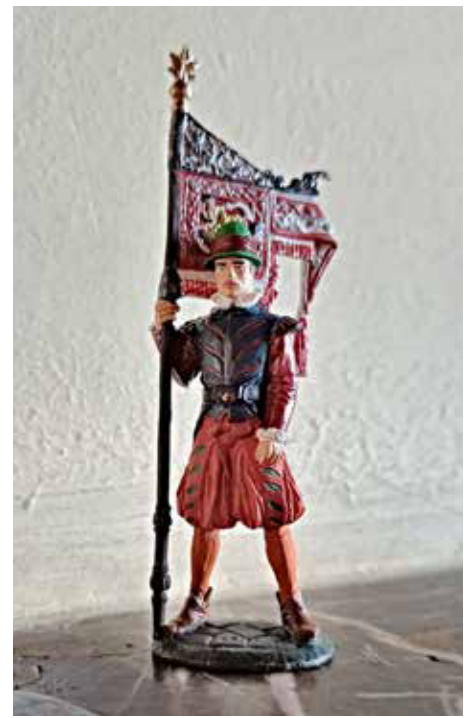
Bannertträger aus dem Berghäuerzug, Zinnfigur.

Was aber sein wird, im Gegensatz zu dem im Artikel zum „Iglauer Silber“ von Johann Achatzi ins „Iglauer Heimatbuch“ übernommenen Text: Es wird Wehmut