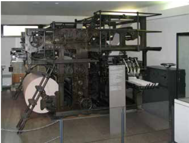
Rotations-Zeitungsdruckmaschine um 1910/1915