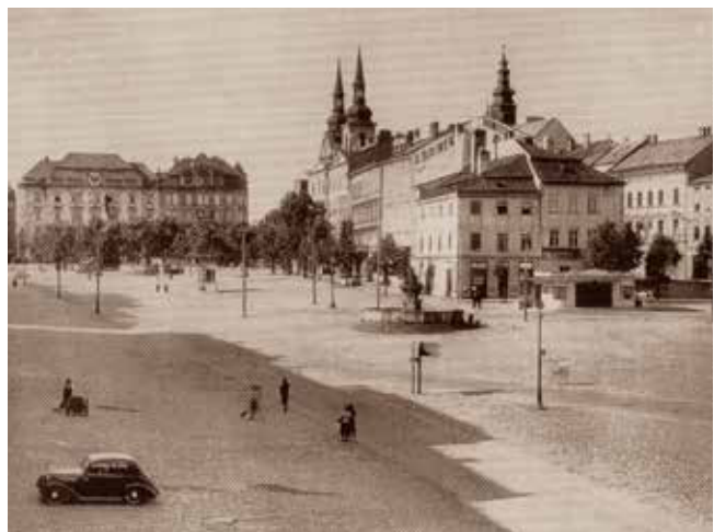
Iglau, alte Ansicht des (unteren) Hauptplatzes, noch mit dem Gebäudekomplex des „Kretzl“.