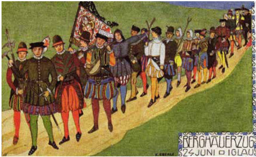
Der Berghäuerzug auf einer alten Postkarte aus dem Bildband von Jaroslav Okáč