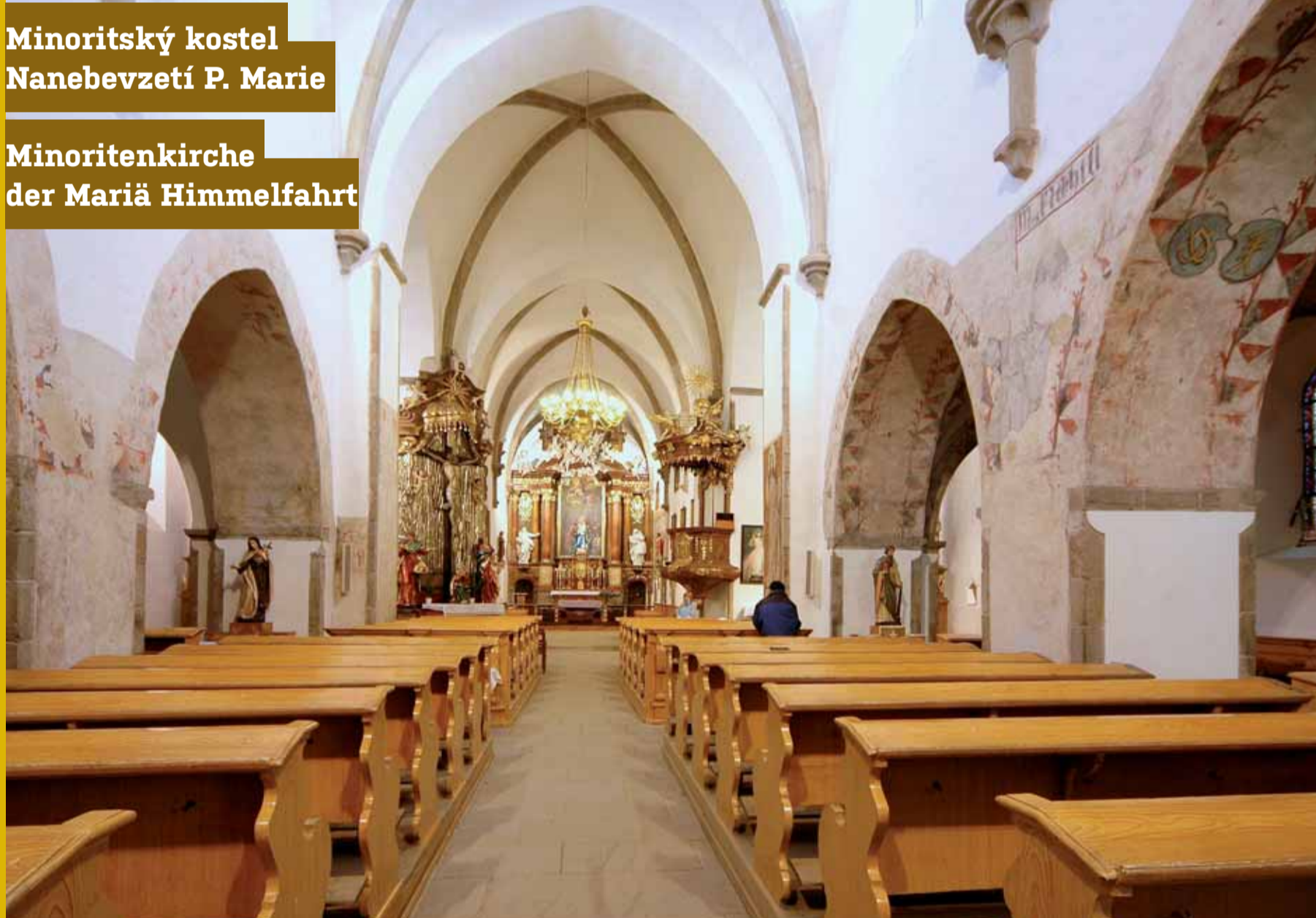
Minoritský kostel Nanebevzeví P. Marie