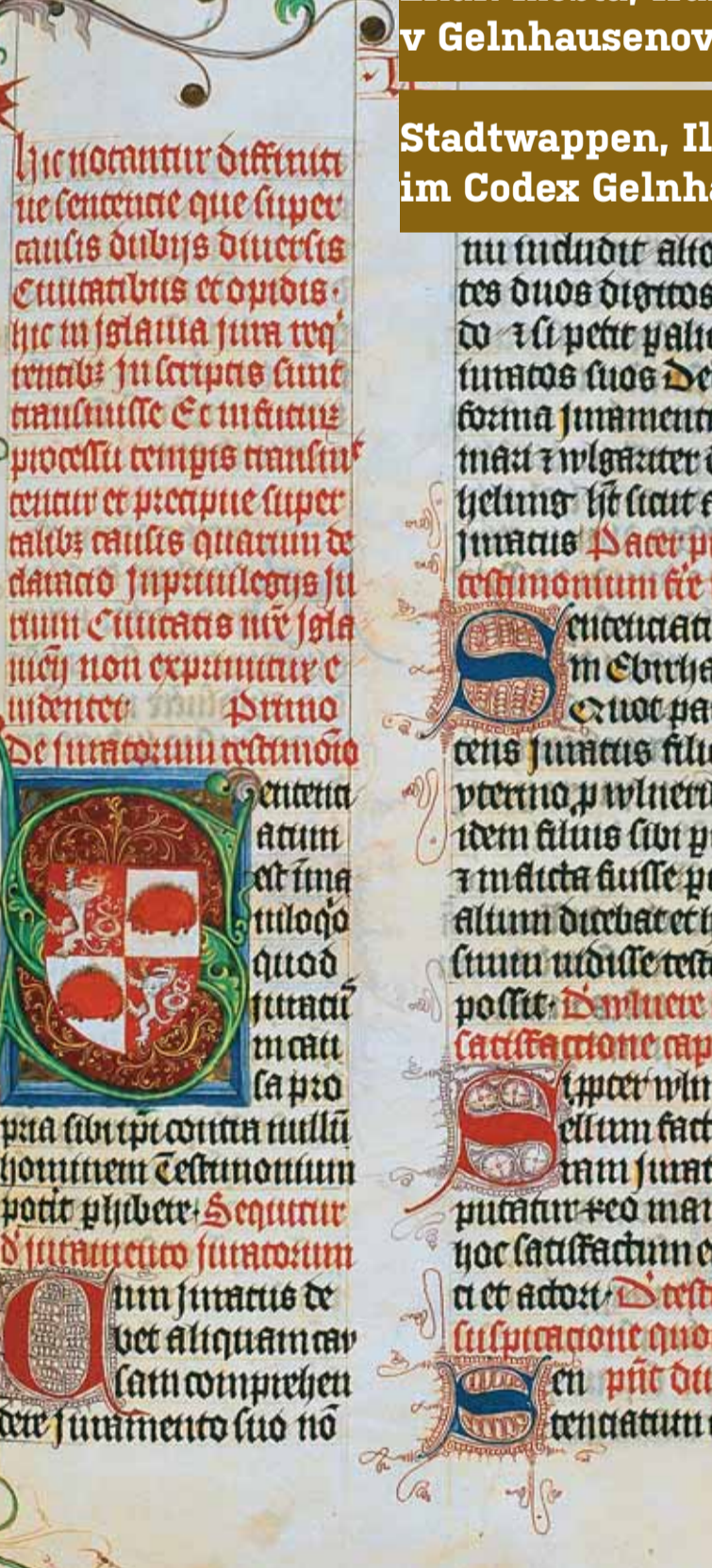
Stadtwappen, Illumination im Codex Gelnhausen, 1400-1408