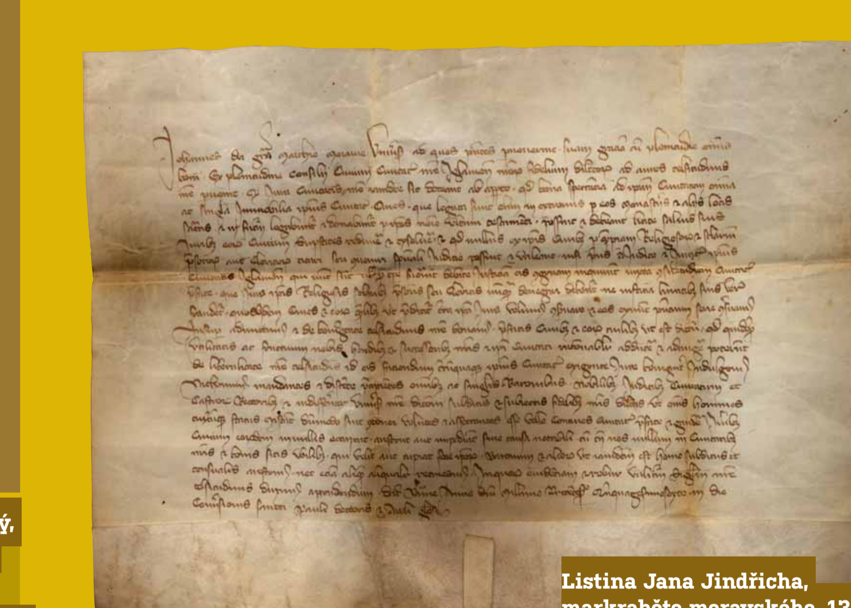
Listina Jana Jindřicha, markrabě moravského, 1356