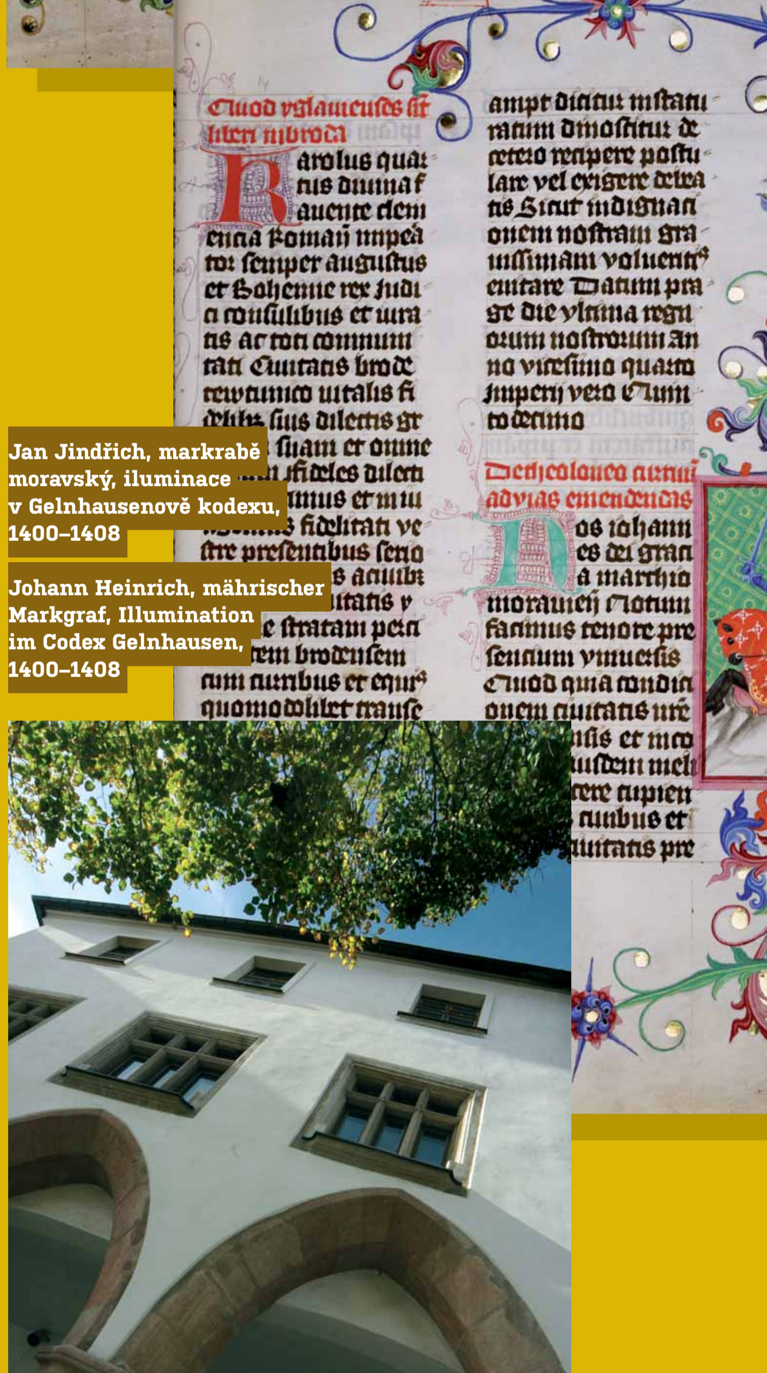
Jan Jindřich, markrabě moravský, iluminace v Gelnhausenuv kodexu, 1400-1408