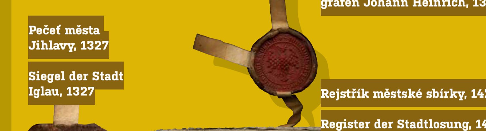
Pečeť města Jihlavy, 1327