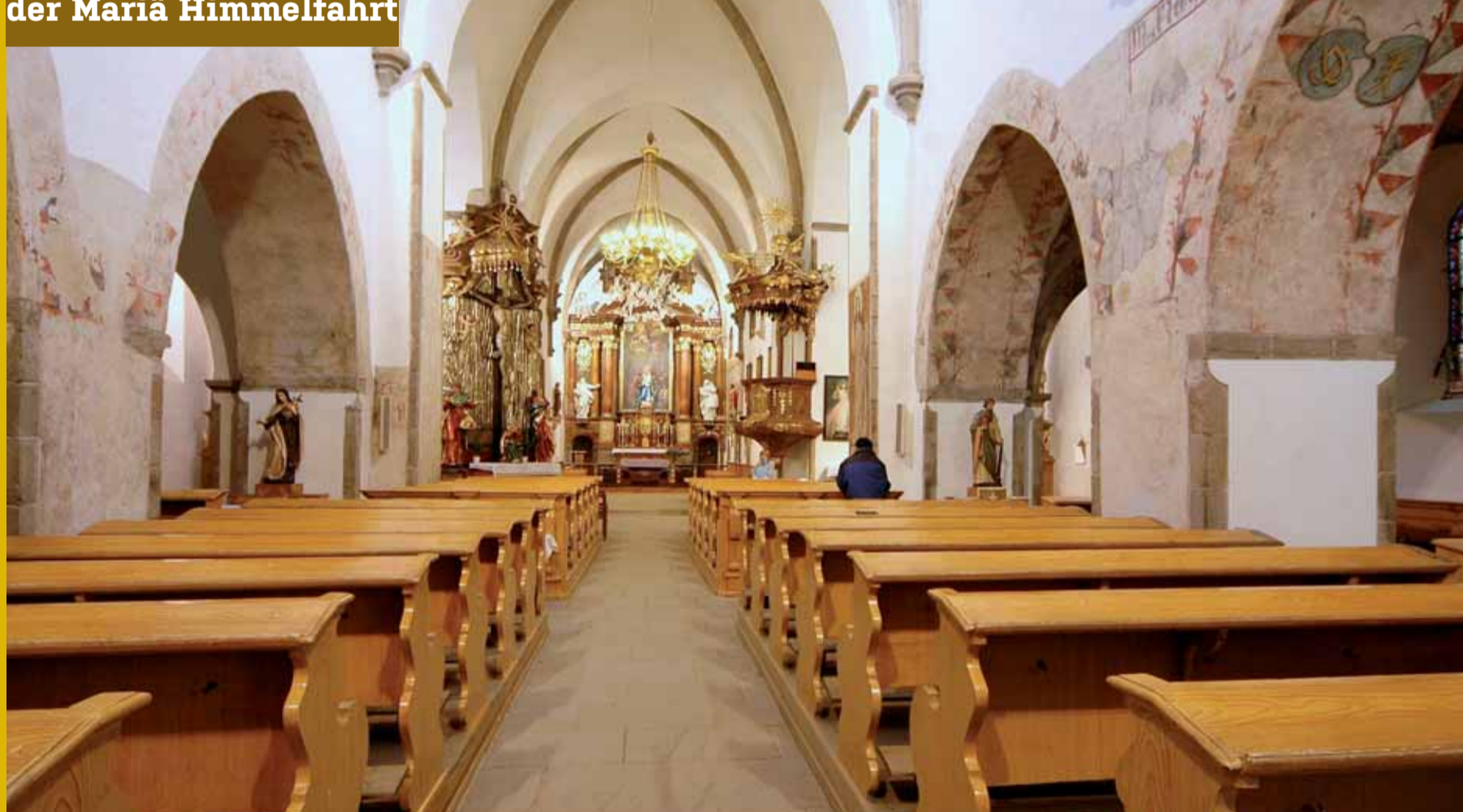
Dominikánský kostel sv. Kříže