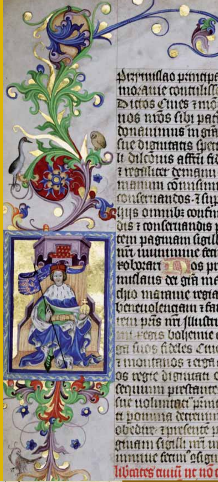
Přemysl, markrabě moravský, iluminace v Gelnhausenuv kodexu, 1400-1408